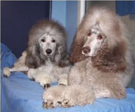
Silver och silver-beige mellanpudlar

de även här. Man kan räkna med att en brun född efter silverföräldrar är en silver-beige. Silver-beige, eller silver-sand som färgen ibland kallas, har brun nostrifyffel och bärnstensfärgade ögon, precis som en brun.